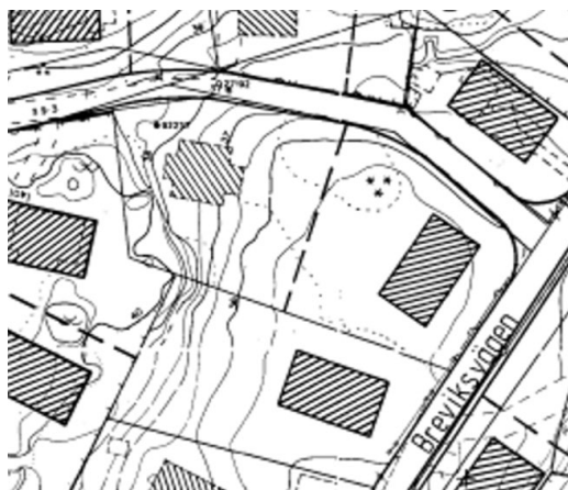
Utdrag ur illustrationsplan i befintlig detaljplan, akt II-3773.